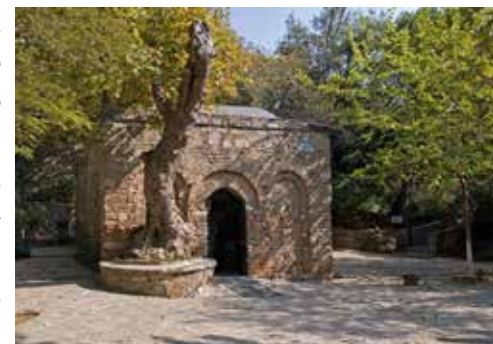
Casa de la Santísima Virgen María

Después de tomar el desayuno en el hotel visitaremos la Casa de la Santísima Virgen María , declarada lugar de peregrinación y visitada por el Papa Pablo VI, Juan Pablo II y Benedicto XVI. Celebración de la Sagrada Eucaristía. Por la tarde tendremos la comida. Visitaremos la Basílica de San Juan , lugar en el que fue enterrado San Juan Evangelista, también declarada lugar de peregrinación por el Papa Pablo VI. Continuaremos hacia Éfeso , una de las siete Iglesias del Apocalipsis, desde donde San Pablo escribió las cartas a los Corintios y a los Gálatas. Posteriormente visitaremos las ruinas bien conservadas de la antigua ciudad: el Teatro, la Biblioteca de Celso, la vía mármol y también la Iglesia de la Santísima Virgen María, donde se celebró el Concilio Ecuménico de Éfeso. Seguiremos hacia la antigua Ciudad de Pergamo uno de los centros culturales, comerciales y médicos del pasado. Visita del famoso Akropolis .