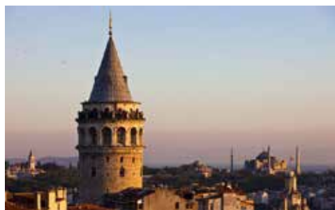
Torre de Galata