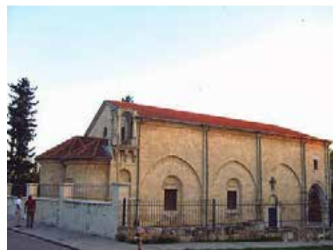
Iglesia de San Pablo