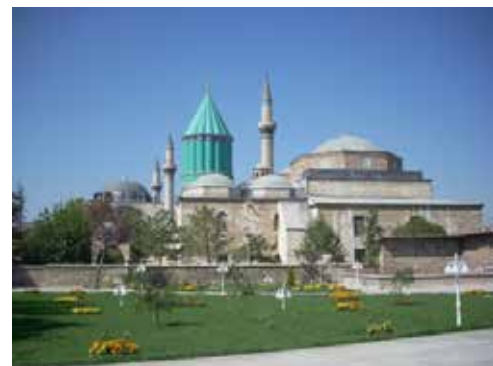
Mausoleo de Mevlana

Después de tomar el desayuno en el hotel nos dirigiremos a Konya, en la ruta visitaremos un Kervansaray del siglo XIII, antigua posada medieval de la ruta de la seda donde tanto los comerciantes como los misioneros que iban de Oriente se alojaban al llegar la noche. Comida. Llegada a Konya "Iconium", ciudad donde San Pablo y San Bernabé predicaron el Evangelio (posteriormente capital de los Selucidas en los siglos XII y XIII). Después de visitar El Mausoleo de Mevlana , fundador de la filosofía de los derviches danzantes. Iglesia de San Pablo , donde celebramos la Eucaristía. Continuamos hacia Pamukkale. Cena y alojamiento en el hotel.