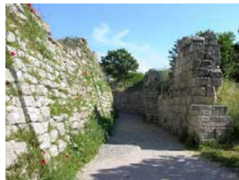
Paredes de la ciudad de Troya